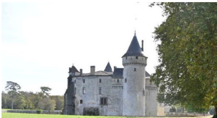
Le château de La Brède

Le Chapitre Magistral organisait la visite du Château de La Brède où vécut Montesquieu. L'occasion de se replonger dans le passé et de mettre nos pas dans ceux de ce grand homme. Un déjeuner clôtura ce moment d'exception.