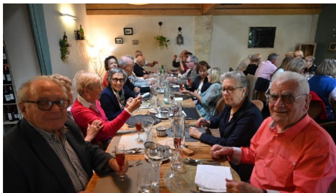
Une belle tablée